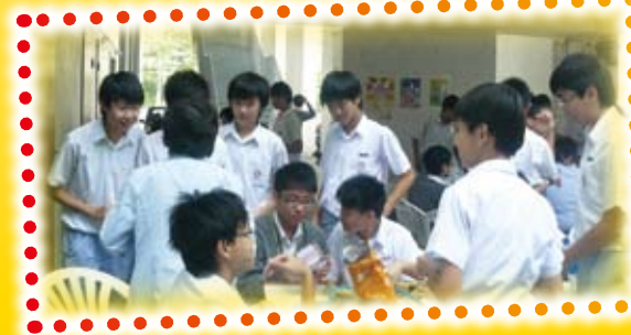
Snacks, games and causal chat at the English Cafe