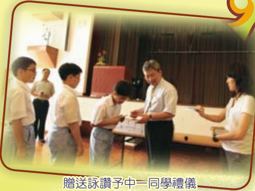
贈送詠讚予中一同學禮儀