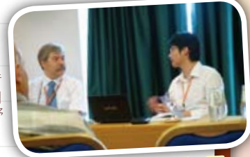
代表劍橋出席歐洲正面心理學會議作圓桌報告

另一句是「知識就是力量」，這是思想家培根的話。我想補充的是，現今是一個知識爆炸的年代，更正確的詮釋可能是：「運用知識才是力量」。希望同學盡量活用自己所學的知識，在求學的過程中體驗運用知識的樂趣。