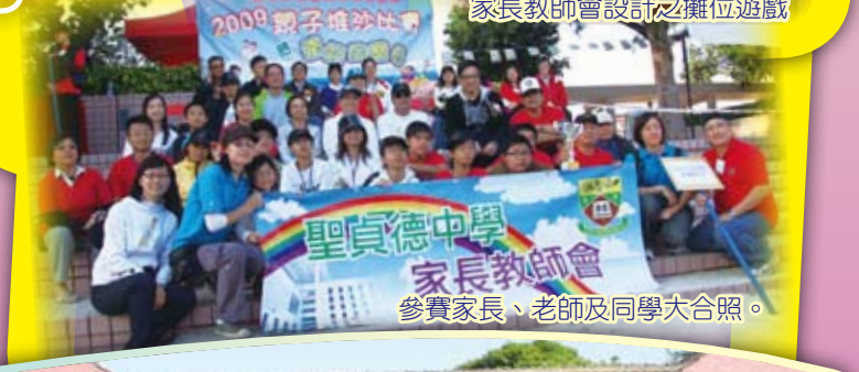
參賽家長、老師及同學大合照。