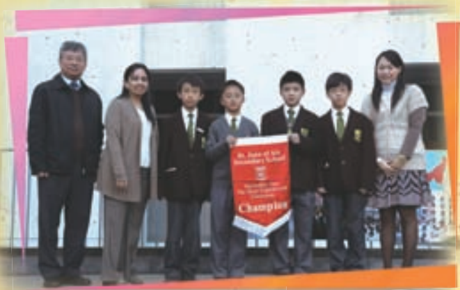
1 Faith and 1 Wisdom

An English-rich environment not only creates physical surroundings for students and teachers, but also contributes to better learning in English. Years after years, teachers and students try their very best to make their classrooms a better place for learning. Various materials, including posters of English activities, students' work, English idioms and proverbs, study tips are posted. Some classrooms are decorated with festive materials conducive to an authentic cultural setting for English learning. With all the effort put forward, the champion goes to 1 Faith and 1 Wisdom in S1, 2 Charity in S2, 3 Faith and 3 Hope in S3, 4 Faith and 4 Justice in S4, 5 Hope in S5 and 6 Hope in S6 and 7.