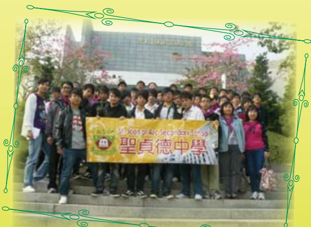
東江縱隊紀念館留影