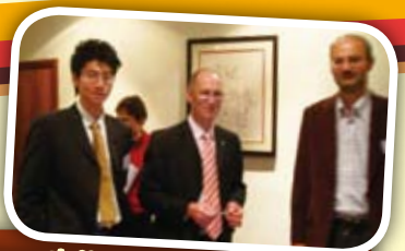
在倫敦高級企業培訓演講