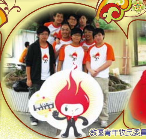
教區青年牧民委員會天主教同學會訓練營