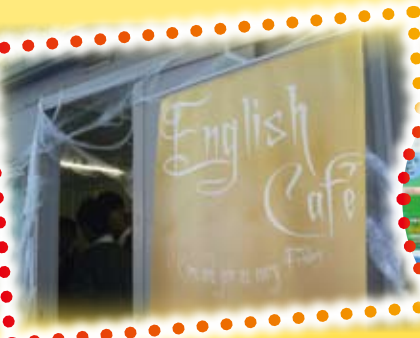
A haunted English Cafe