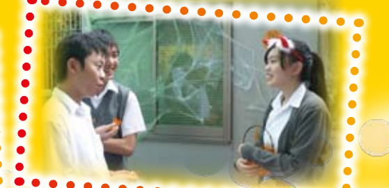
Trick or treat.