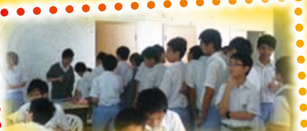
What are they queuing for