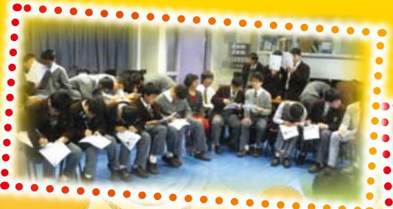
Everyone working hard