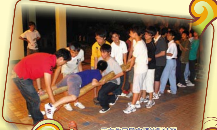
天主教同學會領袖訓練營