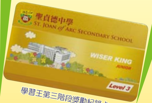
學習王第三階段獎勵紀錄卡