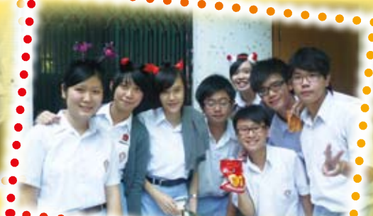
Dressing up for Halloween party