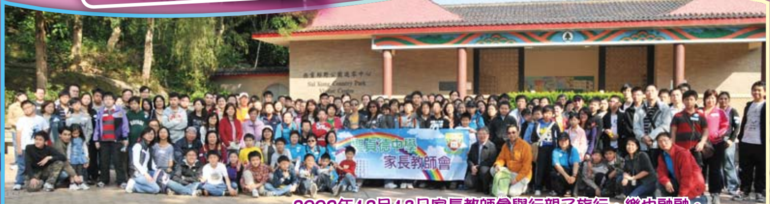
2009年12月13日家長教師會舉行親子旅行，樂也融融。