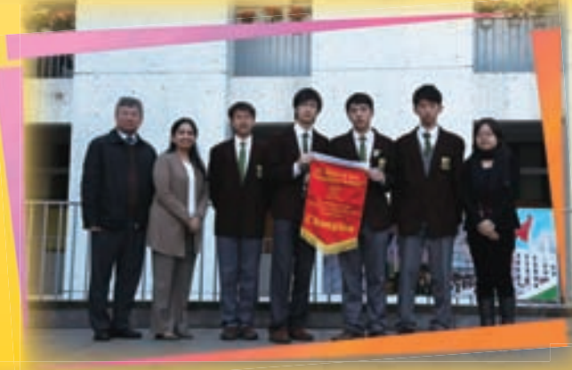
4 Faith and 4 Justice