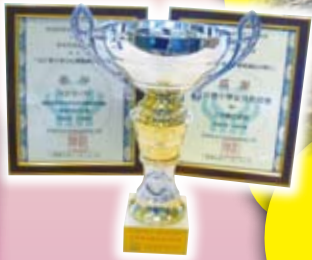
本校家長教師會榮獲東區家教會聯會親子堆沙比賽「最受歡迎」獎。