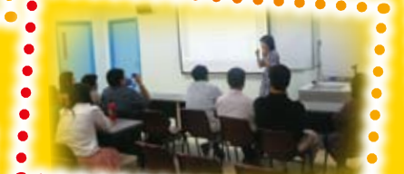
Staff Development Programme