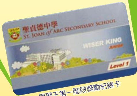
學習王第一階段獎勵紀錄卡

各同學在學期初按自己的能力向班主任領取獎勵紀錄咭一張，紀錄咭以顏色分類：分別為金、銀、藍三色，每種顏色代表一個獎勵層級，藍咭代表第一級；銀咭代表第二級；金咭代表第三級。層級越高，挑戰越大。若同學在各學科測驗取得其自選獎勵咭的要求分數，可獲發貼紙一張。累積至達標後，便可領取獎項，同學每完成一張「獎勵紀錄咭」，即可按意願及能力，領取新咭，再接再勵，於學業上爭取佳績。