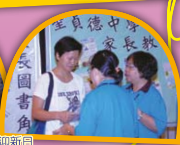
至真德中學 家長教 長圖書角