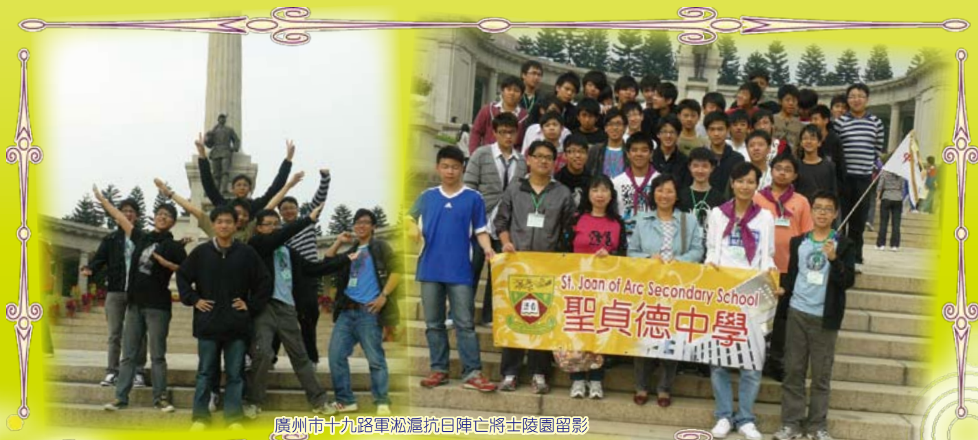
廣州市十九路軍淞滬抗日陣亡將士陵園留影