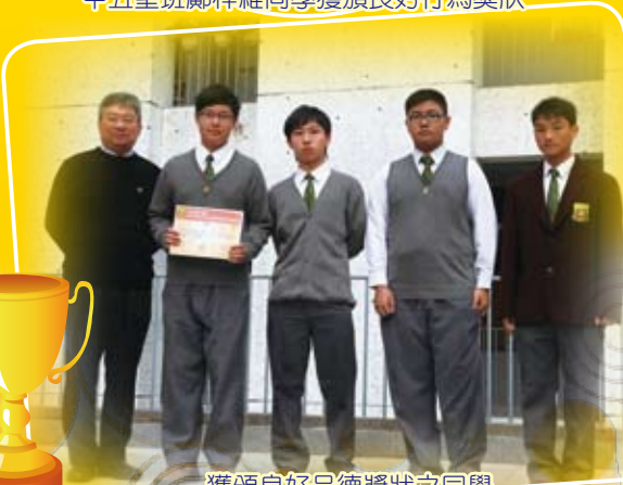
獲頒良好品德獎狀之同學