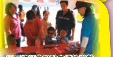
家長教師會設計之攤位遊戲