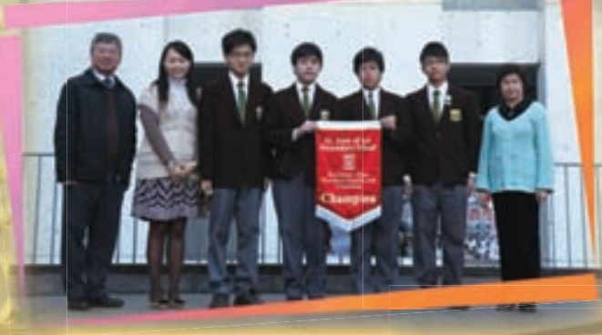
3 Faith and 3 Hope