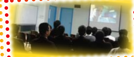
Movie time, lets' enjoy