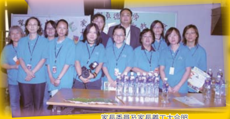
家長委員及家長義工大合照

八月二十二日為本校之新生家長迎新日，家教會委員及家長義工當日向新生家長簡介會務，並招募更多家長參加家長義工隊，加強家校合作。