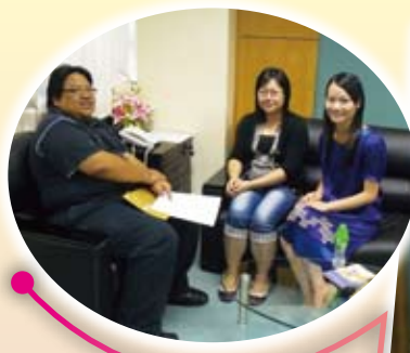
新老師與保母進行交流活動