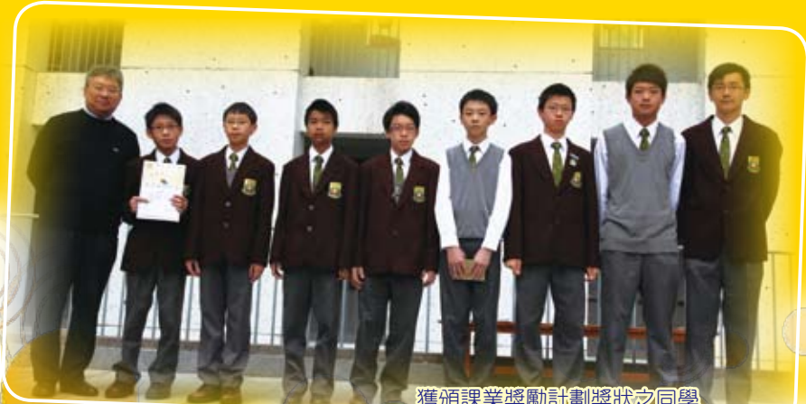
獲頒課業獎勵計劃獎狀之同學