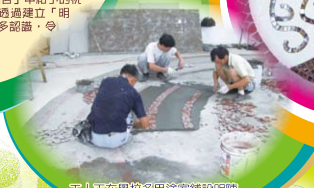
工人正在學校多用途室鋪設明陣