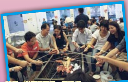
家長、老師與同學一同燒烤

十月十日在學校有蓋操場舉行是次活動，共有184名師生及家長參加。透過燒烤活動，家長與老師互相交流，增進了解。