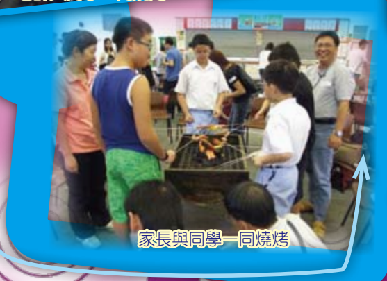
家長與同學一同燒烤