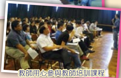
教師用心參與教師培訓課程