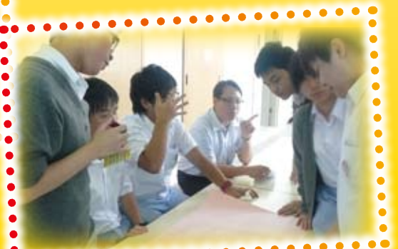
Playing English games with great attention