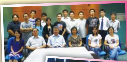
新老師與各保母大合照