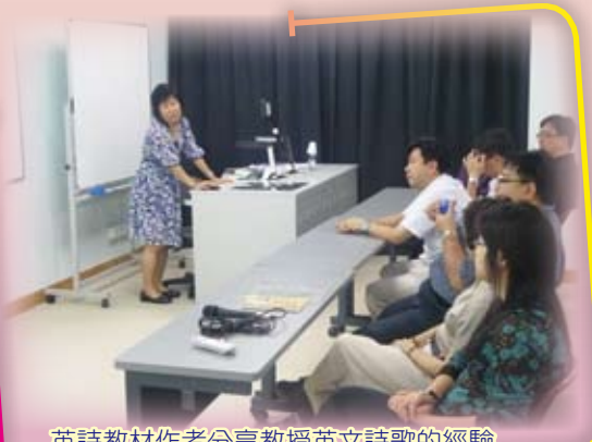
英詩教材作者分享教授英文詩歌的經驗

本校英文科於2009年11月12日舉辦了英語教師專業發展活動，邀請教學經驗豐富的英詩教材作者分享教授英文詩歌的經驗。