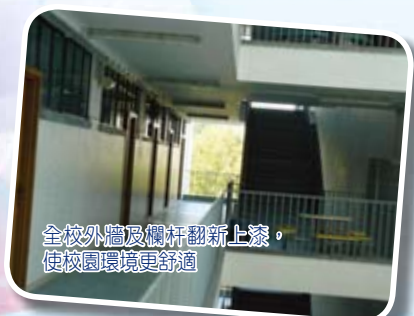
全校外牆及欄杆翻新上漆，使校園環境更舒適