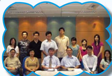
新老師與各媒母大合照