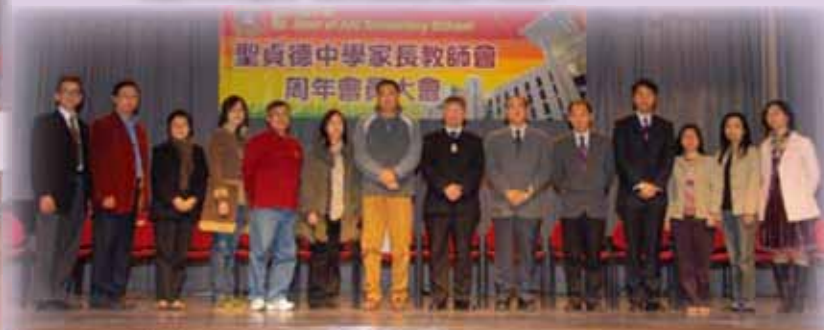
第三十八屆執行委員會就職禮