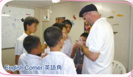
English Corner 英語角