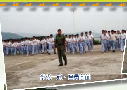
步伐一致，奮勇向前

為了令學生將訓練營的學習和體會活學活用，於生活中發揮實踐，學校安排訓練營導師和學生重聚，讓導師進一步引發同學反思，強化他們的信念。本校學生事務組亦會跟進學生在訓練營中的表現，舉辦不同的培訓活動，加強同學認識自我及發揮領導才能。