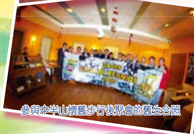
參與中半山懷舊步行後聚會的舊生合照