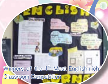
Winners of the 1 st Most English-rich Classroom Competition