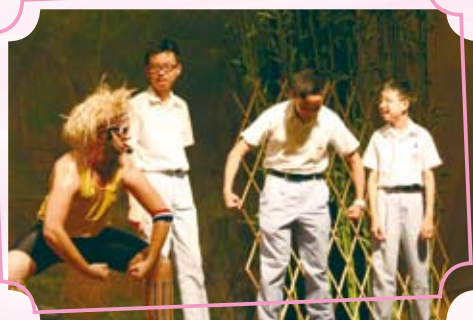
Dancing with Franz, a newly-created character in the Legend of Mulan