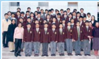
Participants in Solo Verse Speaking and their teacher trainers