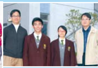
Participants in Prose reading and their teacher trainers