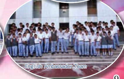
English Ambassador Team