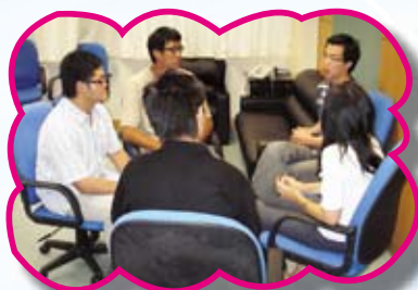
新老師與媒母進行交流活動