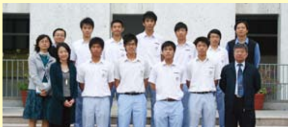
學民聯成功當選為新一屆學生會幹事會