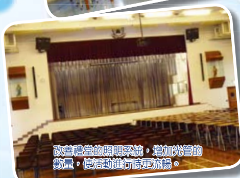
改善禮堂的照明系統，增加光管的數量，使活動進行時更流暢。