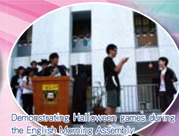
Demonstrating Halloween games during the English Morning Assembly