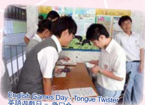
English Games Day - Tongue Twister 英語遊戲日 - 急口令