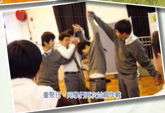
重聚日，同學們再次並肩作戰