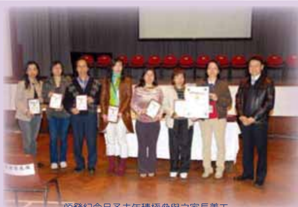
頒發紀念品予去年積極參與之家長義工