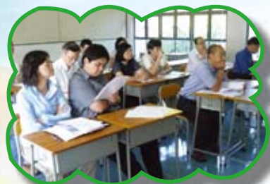
教師用心觀看觀課片段