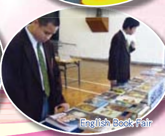
English Book Fair