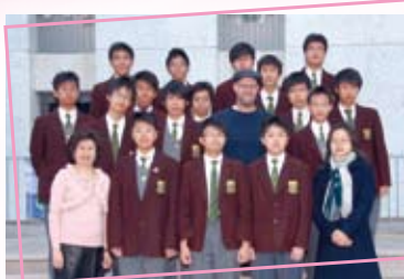
Participants in Public Speaking Team and their teacher trainers