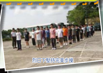
烈日下堅持完美步操