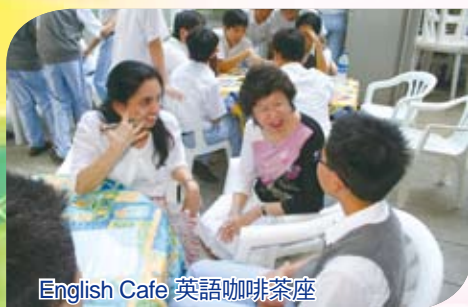
English Cafe 英語咖啡茶座

自2007年起，我們得到教育局「提昇英語水平計劃」的撥款。透過多元化的英語活動，支援同學在常規英語課程之外的英語學習和訓練。因此，我們積極鼓勵同學參與各類型的公開比賽，雖然勝負很多時候只是一線之差，為同學最重要的卻是視野的擴闊、整個參與和備戰的過程。就以本年的校際英語朗誦節為例，參與個人賽事的同學便接近九十人次，獲獎項目甚多，成績令人鼓舞。