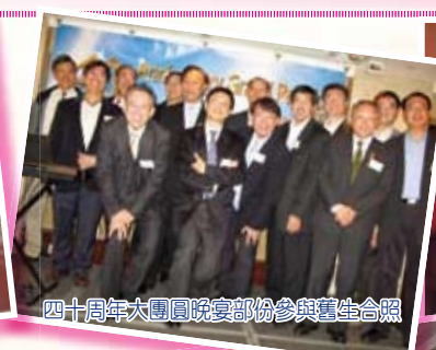
四十周年大團圓晚宴部份參與舊生合照