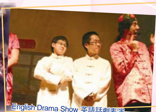
English Drama Show 英語話劇表演