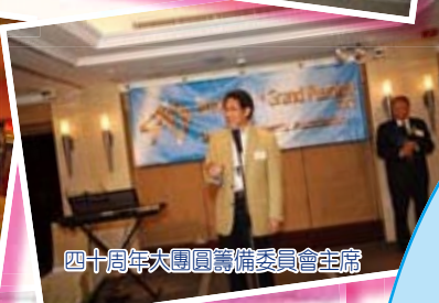
四十周年大團圓籌備委員會主席