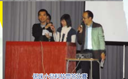
係咪小兒科技問答比賽