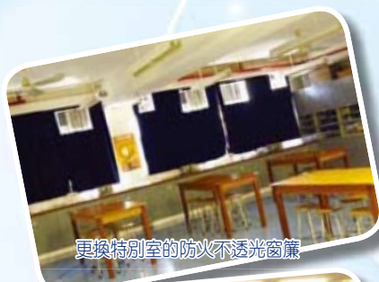
更換特別室的防火不透光窗簾

本校一向重視學生在校內的學習環境，今年再進一步善化學校設施，讓學生可以在優質的校園內，開心地生活和學習。