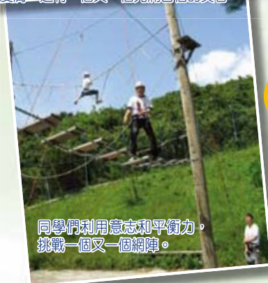
同學們利用意志和平衡力，挑戰一個又一個網陣。