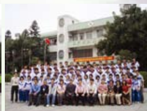
師生到訪西洲中學，交流學習