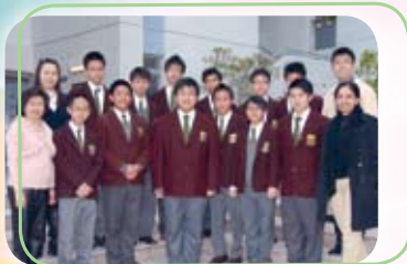
Participants in Public speaking solo and their teacher trainers