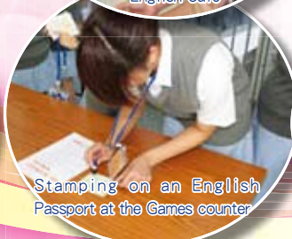
Stamping on an English Passport at the Games counter