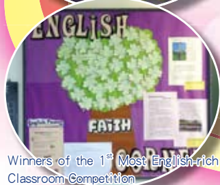
Winners of the 1 st Most English-rich Classroom Competition