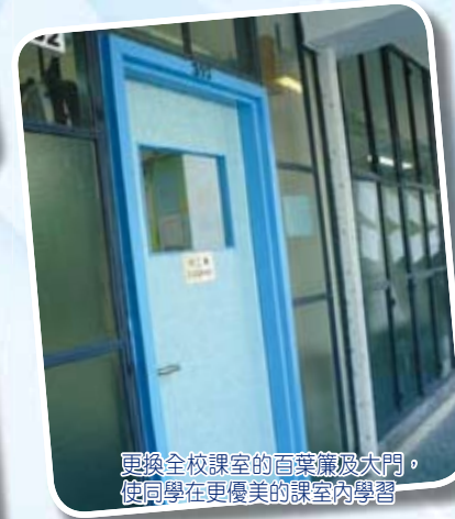
更換全校課室的百葉簾及大門，使同學在更優美的課室內學習