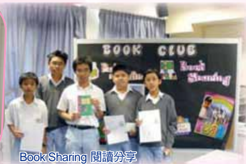
Book Sharing 閱讀分享