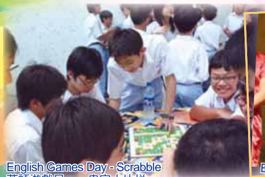
English Games Day - Scrabble 英語遊戲日——串字大比拼