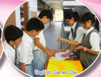
English Games Day