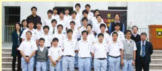
劉校長與新一屆學生會代表會合照

經全體同學一人一票，本校第十四屆學生會幹事會及代表會於零八年十一月順利選出，並立即投入為同學服務。是次幹事會選舉共有兩個內閣參選，分別為「Jump」及「學民聯」。最後，「學民聯」獲得較多票數，成功當選。