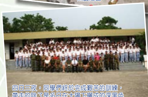
四日三夜，同學們終於完成艱苦的訓練，帶走的除了是多日在太陽下曬成的深黑色皮膚，還有一個又一個充滿自信的笑容。